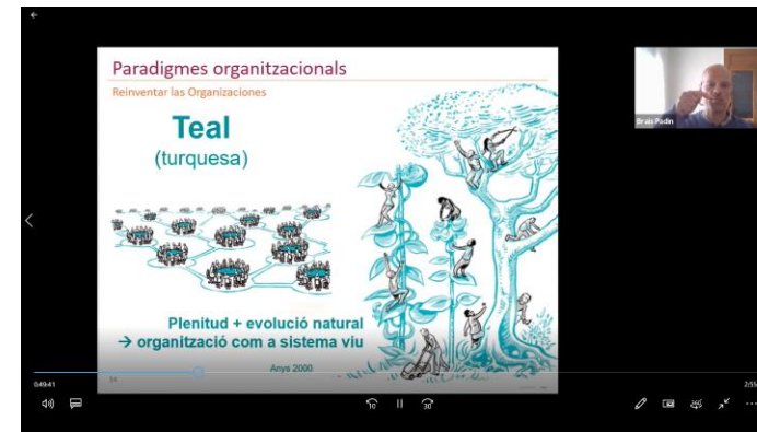
Brais Padin , consultor Vector5 | excel·lència i sostenibilitat SCCL: Nous sistemes de gestió organitzacional.