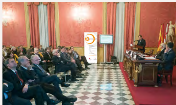
Acte de presentació de Respon.cat (Casa Llotja de Mar, Barcelona 5 de febrer de 2014)

Respon.cat es va constituir com a associació empresarial el febrer de 2015, si bé va començar a funcionar durant els mesos previs sota els auspicis del Consell de Cambres de Comerç de Catalunya. Actualment està constituïda per més de 110 empreses adherides , amb una gran diversitat de sectors i dimensions . Un terç correspon a empreses grans, un terç a mitjanes i un terç a petites. Les portes estan obertes a totes les organitzacions amb un compromís de gestió responsable i la voluntat de promoure l'RSE entre el teixit empresarial català. Les empreses membres es fan càrrec de les despeses de funcionament amb les quotes anuals.